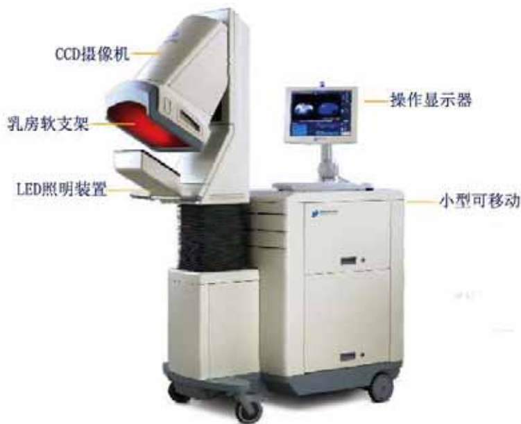
（图 1）舒怡乳腺成像系统结构图