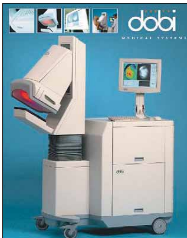
Obr. 2 DOBI ComfortScanner

Výsledky mamografií podle šestistupňové klasifikace BI-RADS jsme zařadili do skupiny MG-positivní nebo MG-negativní stejně jako se používá toto hodnocení v MG screeningu výsledek mamografie BI-RADS 1, 2 a 3 do skupiny negativních a výsledek BI-RADS 0, 4 a 5 do skupiny pozitivních mamografií. Na hodnocení denzity žlázy byla použita pětistupňová klasifikace dle Tabára (Tabár I až V).